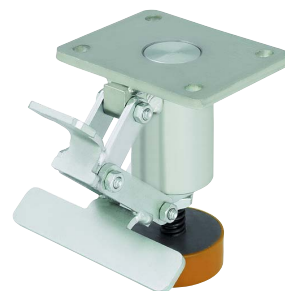
Blickle rögzítőláb (Rendelési szám.: FF160 / FF200)

Ez egy olyan talpra hegesztett iránytartó, melyet a szabványos 180°-os helyzet mellett (kiegészítő rendelési kód: -RI2, két rögzítőpozíció) megfelelő megrendelési szám esetén egyéni igények alapján is elkészítenek (pl. kiegészítő rendelési kód: RI4, négy rögzítőpozíció). Ez a kivétel meglehetősen robusztus és a nagy teherbírású kerekek rögzítésére alkalmas. Ez a tartozék különböző nagy teherbírású forgóvilla-sorozatokhoz szállítható. Lásd "Opciók/Tartozékok" alatt a különböző táblázatokban.