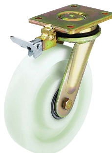
Blickle iránytartó fék hegesztett acél forgóvillás görgők számára (kiegészítő rendelési kód: -RI...)

Ezt az iránytartó féket külön alkatrészként szállítják, és rá kell szerelni a forgóvillára. Későbbi felszerelése is lehetséges, mivel nem kell az adott villához hozzáigazítani. Ez a tartozék több forgóvilla-sorozatnál szállítható. Lásd "Opciók/Tartozékok" alatt a különböző táblázatokban.