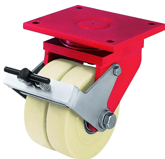
Blickle kerékrögzőtő fék „Radstop“ nagy teherbírású görgők számára (kiegészítő rendelési kód: -RA)

Ez a rögzítő elem egy nyomáson alapuló egyszerű és nagyon stabil fék-rendszer. A féket vagy lábbal, vagy csavarkulccsal lehet működésbe hozni, és igen magas fékező erőt lehet vele kifejteni úgy, hogy a legnagyobb megterhelés mellett is stabil rögzítést biztosít. Ikergörgő esetén a fék mindkét kerékre egyszerre hat. Ez az tartozék különböző hegesztett acél forgóvilla keréksorozathoz szállítható. Lásd "Opciók/Tartozékok" alatt a különböző táblázatokban.