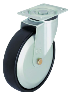
Porvédő (kiegészítő rendelési kód: -FA ill. -FK)

A porvédő korong szabvány szerint préselt és horganyzott acéllemezből készül (kiegészítő rendelési kód: -FA) vagy fröccsöntött műanyagból (kiegészítő rendelési kód: -FK).