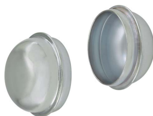
Porvédő kerécsapka tengelyre szerelhető kerekeknél (kiegészítő rendelési kód: -E)

A kerécsapágy két oldalára szerelik, ami megakadályozza fonal, stb. körbetekeredését a tengely körül, és ezzel a kerék blokkolását. A porvédő a kerékagy mellett az egész központi részt befedi, így akadályozva meg a kerécsapágy szennyeződését. Ez a tartozék sok forgó- és fixvillás görgőhöz szállítható. Lásd "Opciók/Tartozékok" alatt a különböző táblázatokban.